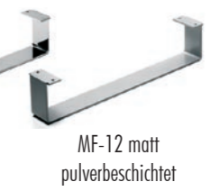
MF-12 matt pulverbeschichtet