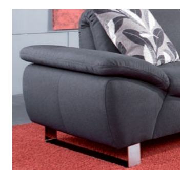
Armlehne A fest