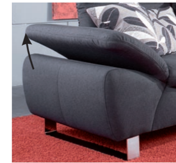
Armlehne B klappbar, Mehrpreis - siehe Preisliste

Bei Sofatypen werden prinzipiell beide Armlehnen in der gewählten Ausführung gefertigt. Die kompletten Mehrpreis für beide Armtile finden Sie in der Preisliste unter der jeweiligen Typenbezeichnung.