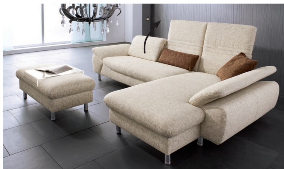
▲ Zusammenstellung: EL135 - LCH - JH, Bezug: 6/ Laredo natur

Zusammenstellung: EL135 - EAH 210, Bezug 6/Sofia schwarz